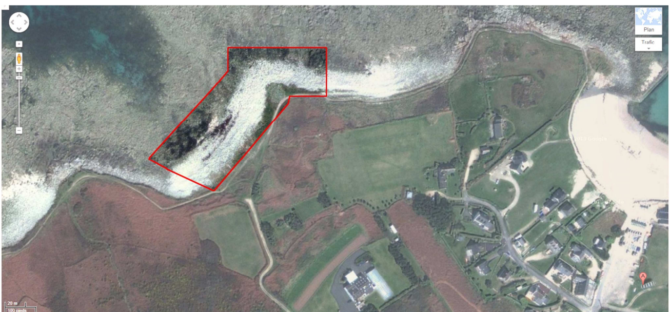
L'Île Grande – Côtes d'Armor

Le lieu de prise de vue se trouve sur l'Île Grande au nord de Pleumeur-Bodou. C'est une bande de cailloux de 80 mètre de long et 20 mètre de large. Très sensible à la houle, par jour de grande tempête, les cairns peuvent disparaître. Les photos sont prises depuis les années 2008.